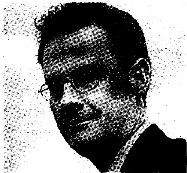
Nicholas G. Carr.

El ex editor de Harvard Business Review”, Nicholas G. Carr, afirma en una entrevista que las tecnologías de la información ya no aportan ventajas competitivas a las empresas porque están al alcance de todas y son algo común. PÁGINA 5